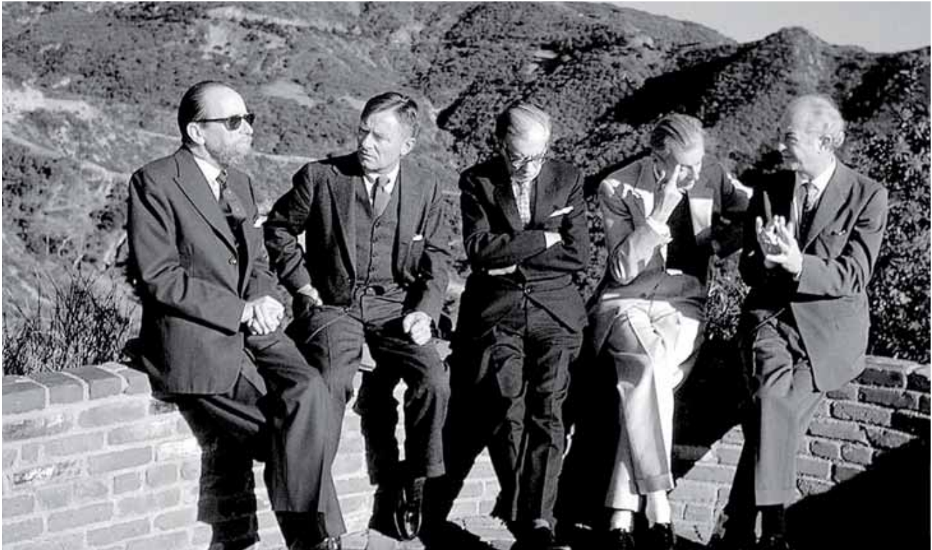
Von links nach rechts: Gerald Heard, Christopher Isherwood, Julian Huxley, Aldous Huxley, Linus Pauling

borene Arnold, eine eigene von idealistischen Bildungszielen und liberalen Erziehungsmethoden inspirierte Schule, »zu Beginn mit sechs Schülerinnen, einem strubbeligen Terrier und dem siebeneinhalbjährigen Aldous«, wie in der Broschüre zur 100-Jahrfeier der Prior's Field School zu lesen ist. Ihr Gründungsmotto ist ein Zitat des Dichters William Wordsworth: »Wir leben durch Bewunderung, Hoffnung und Liebe« (We live by Admiration, Hope and Love). Schon Julias Großvater Thomas Arnold war Mitte des 19. Jahrhunderts ein angesehener Pädagoge und Theologe und richtungsweisender Reformator des britischen Erziehungswesens.